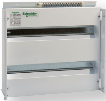
SRH36MOD komplett med avdekning