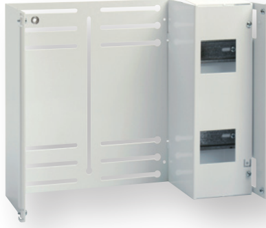
SRHMI, komplett med avdekning